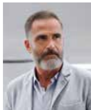
Simon Becker Home One GmbH

”Mit digitalen Planungs- und Managementmethoden die Baubranche fit für die Herausforderungen der Zukunft machen.“